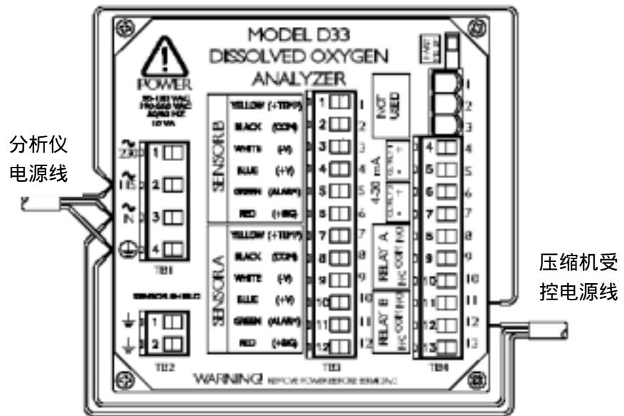
图 2-10 D33 分析仪与空气压缩机的接线